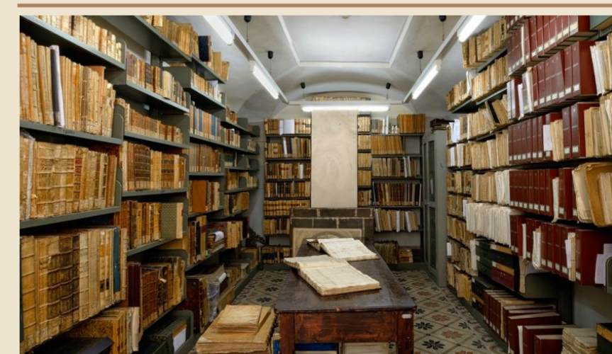
Biblioteca del Conservatorio Cherubini ▲

Musiche di Giulio Briccialdi e Cesare Ciardi